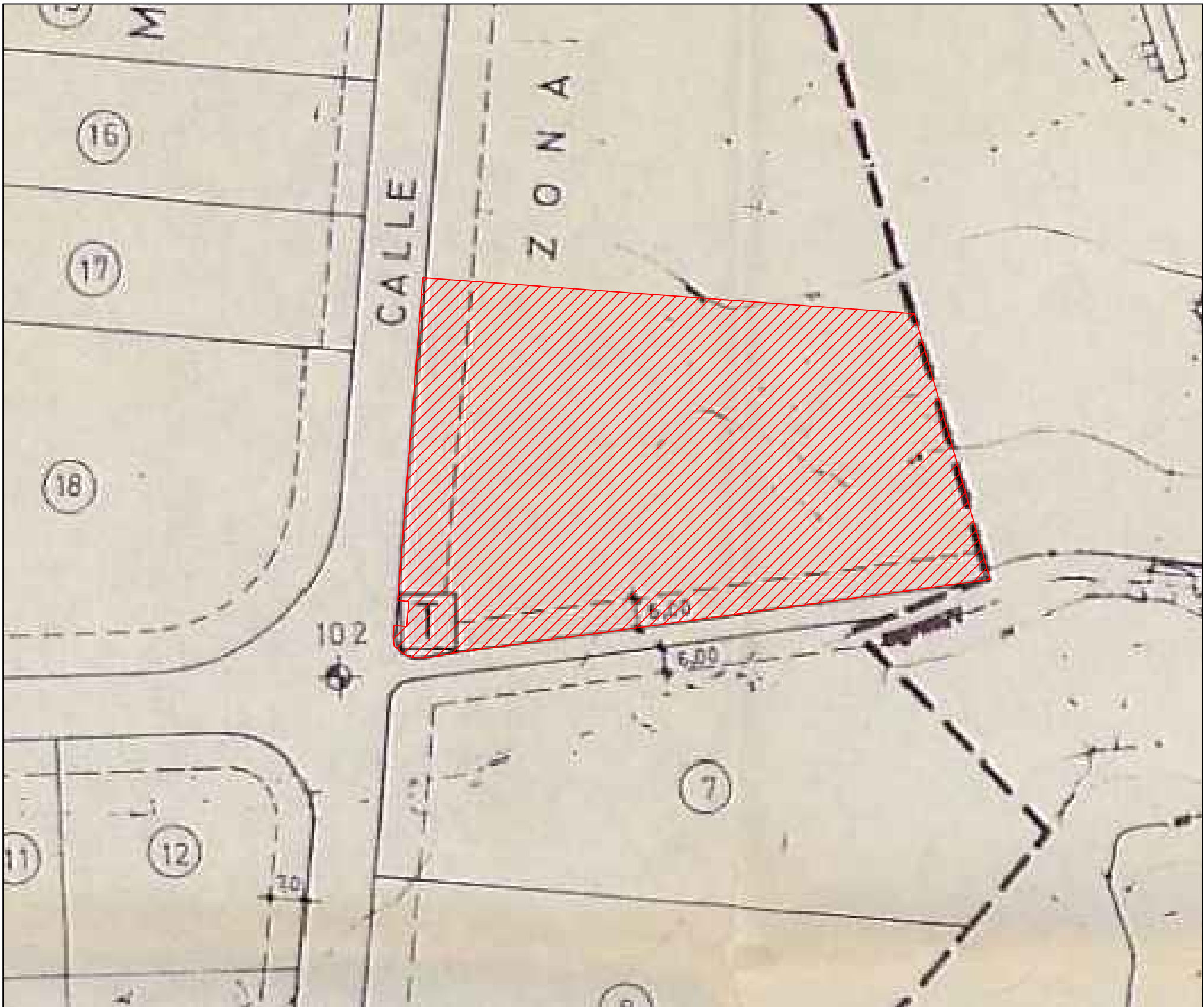
Emplazamiento de la parcela sobre el plano de ordenación del Plan Parcial