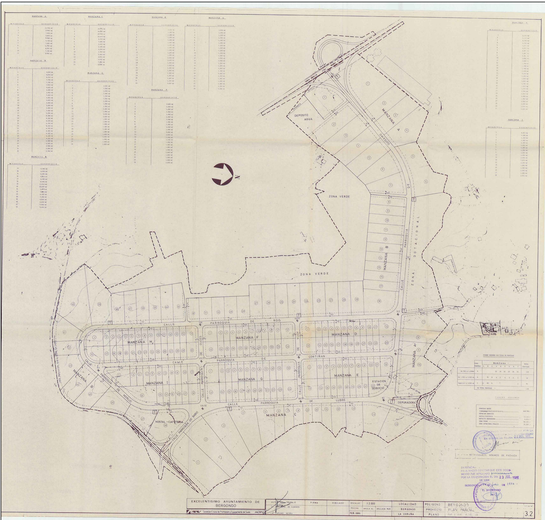
Plano de ordenación del Plan Parcial