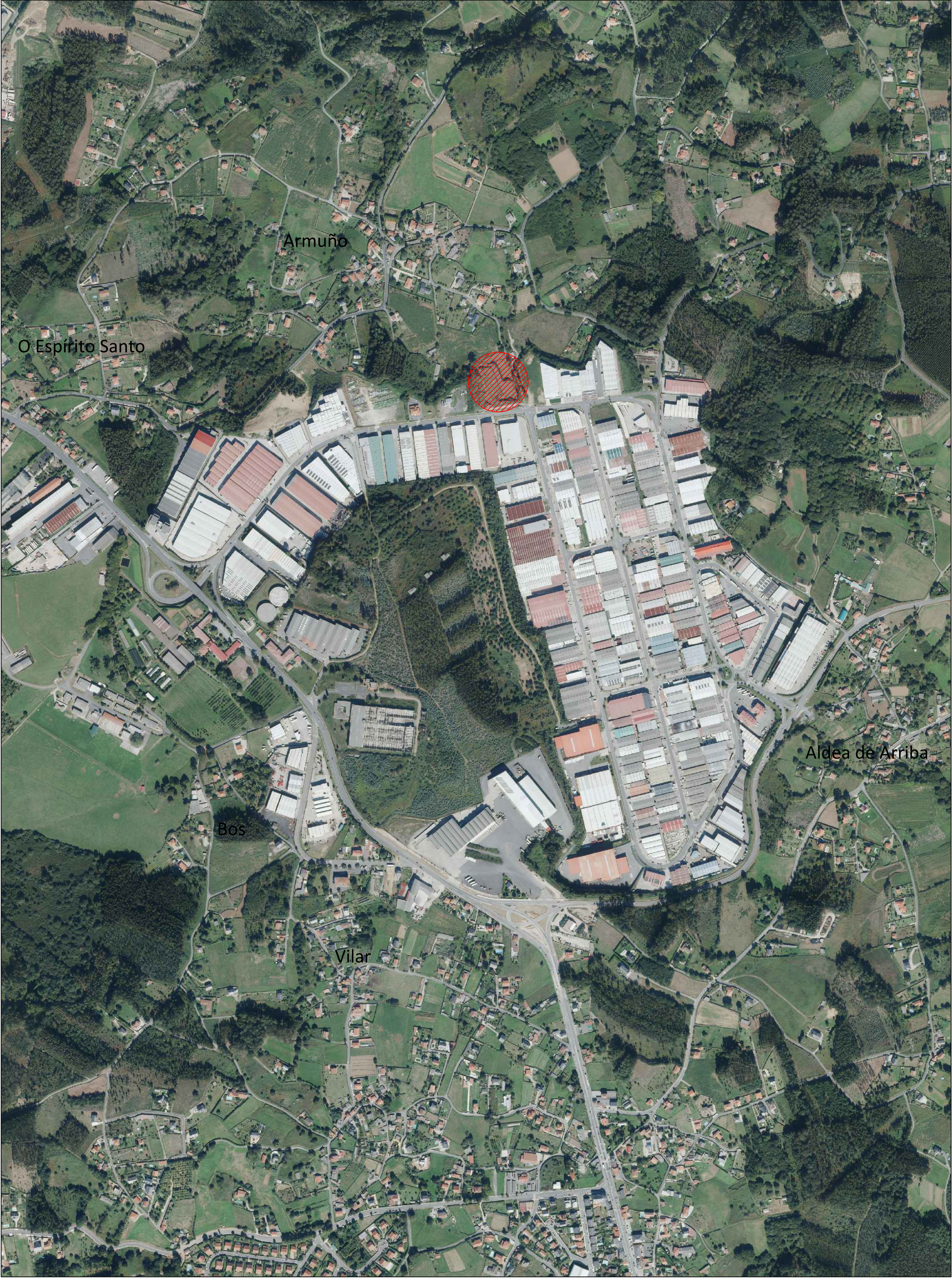
Situación de la parcela sobre la imagen del Polígono